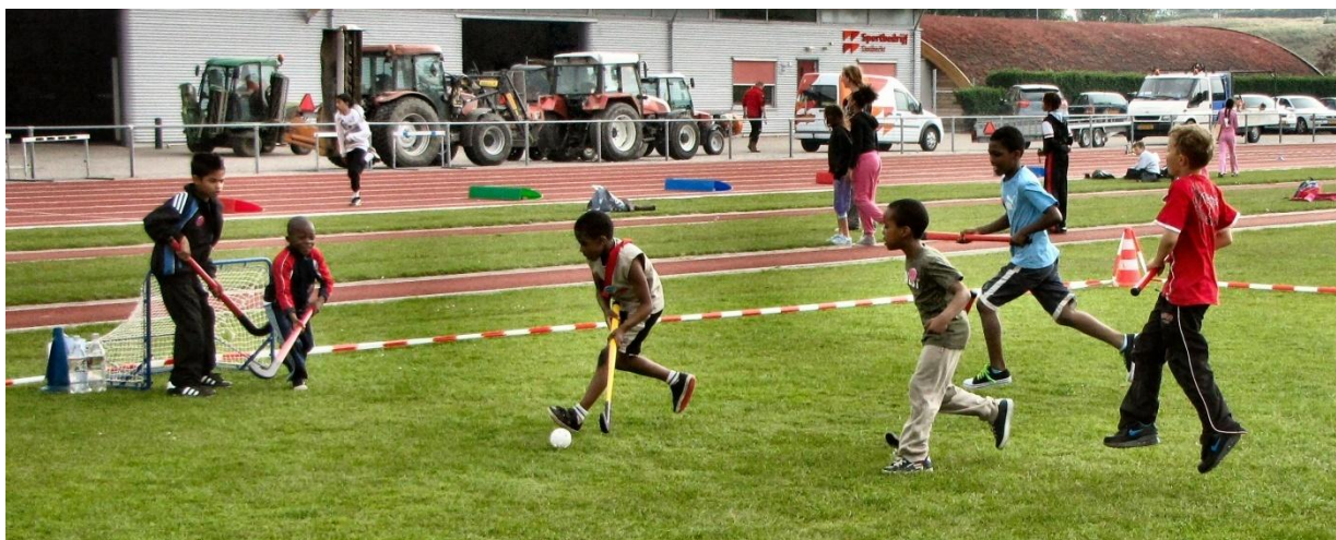
Onder en boven: Kinderen van groep 3 t/m 8 sporten enthousiast tijdens de sportdag

De school organiseert, vaak samen met de oudervereniging, een aantal activiteiten. Jaarlijks hebben we op school de bekende feesten zoals het Sinterklaasfeest, Kerstmis en Pasen. Jaarlijks is er een sportdag voor groep 3 t/m 8.