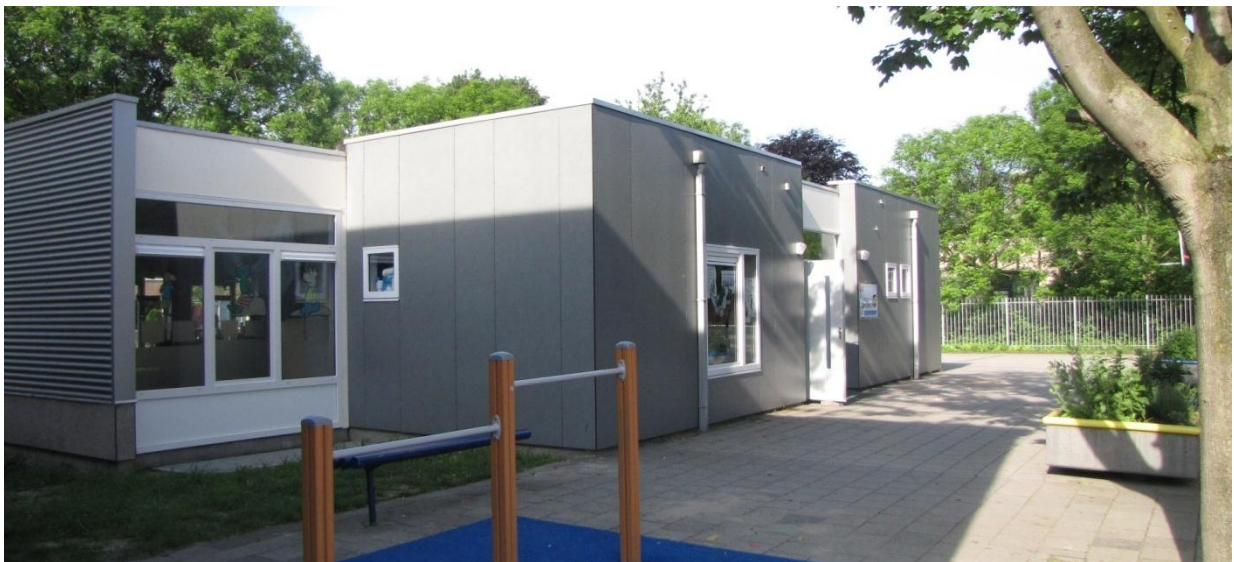
De gebouwen voor de groepen 1 en 2 van de Don Bosco School (onder en boven)

Zelfstandig werken is geen vak op zich, maar een manier van werken. Kinderen worden zelf verantwoordelijk gemaakt voor het indelen van hun werk, plannen van opdrachten, keuzes maken in extra opdrachten om zo een week- of dagtaak op een goede manier te leren en te maken. Kinderen die dat goed beheersen zullen daar voordeel van hebben in het voortgezet onderwijs.