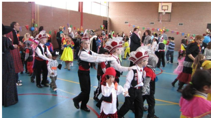
Carnaval in de sportzaal van de Don Bosco school.