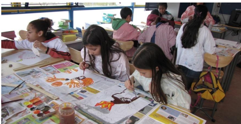
Diepe concentratie tijdens het

Tijdens die activiteiten wordt er hard gewerkt om kinderen vertrouwd te maken met regels en afspraken, om hun zelfstandigheid en zelfredzaamheid te vergroten. De ontwikkeling van sociale vaardigheden krijgt veel aandacht.