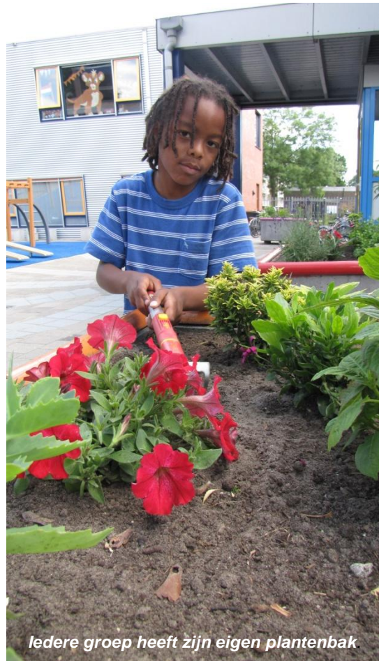
Iedere groep heeft zijn eigen plantenbak

De activiteiten zijn per cursusjaar verschillend. U kunt via onze nieuwsbrieven vernemen welke activiteiten er worden georganiseerd.