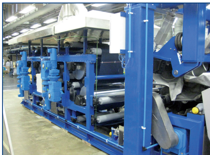
Realisatie laboratorium papiermachine